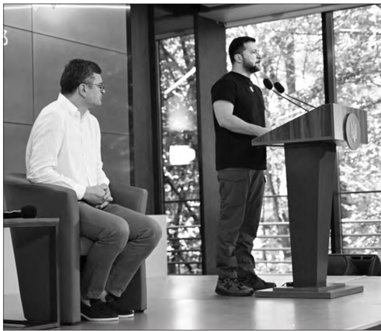
Дмитро Кулеба та Володимир Зеленський під час конференції керівників закордонних дипломатичних установ України.

«Цього місяця почнеться тренування наших українських пілотів. Зараз варто працювати на сто відсотків із країнами, які мають ці літаки та які зможуть нам після навчання їх передати. Це