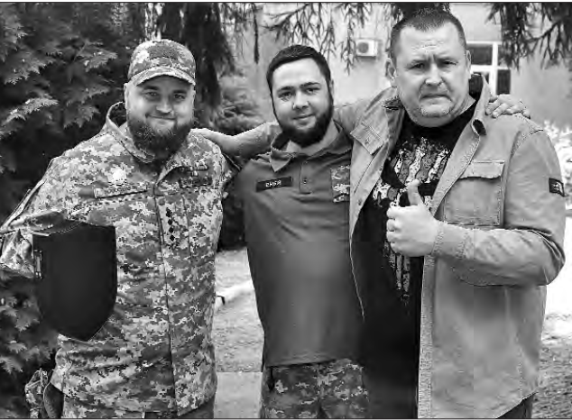
Черговий вітчизняний пристрій, здатний зупинити майже всі види ворожих безпілотників у радіусі до понад півтора кілометра, отримали оборонці від громади Дніпра.

Надана антидронна система важить лише півтора кілограма і здатна працювати і в лютий мороз, і у сильну спеку. «Це український виробник. Дуже потужний