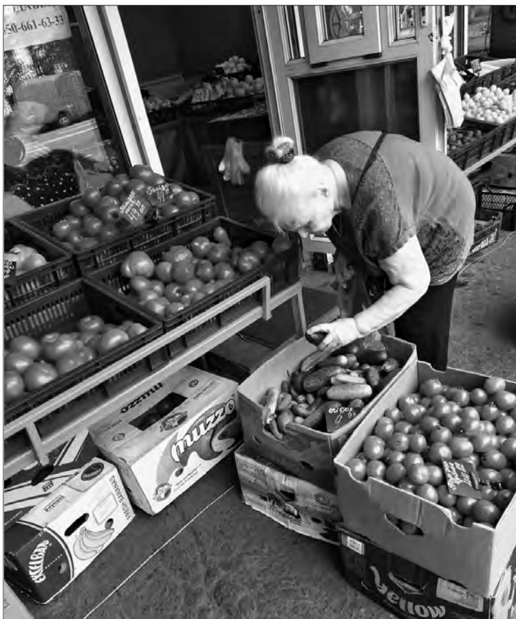
У Києві кілограм огірків також можна придбати менш як за десять гривень.

Тут не все так просто. Переважну частку саме ранньої овочевої продукції завозили із-за кордону. Тому, скажімо, молодий часник у червні сягав 200 гривень за кілограм. Зате тепер, коли вже зібраний урожай свого, він коштує 50—60 гривень. Така сама картина