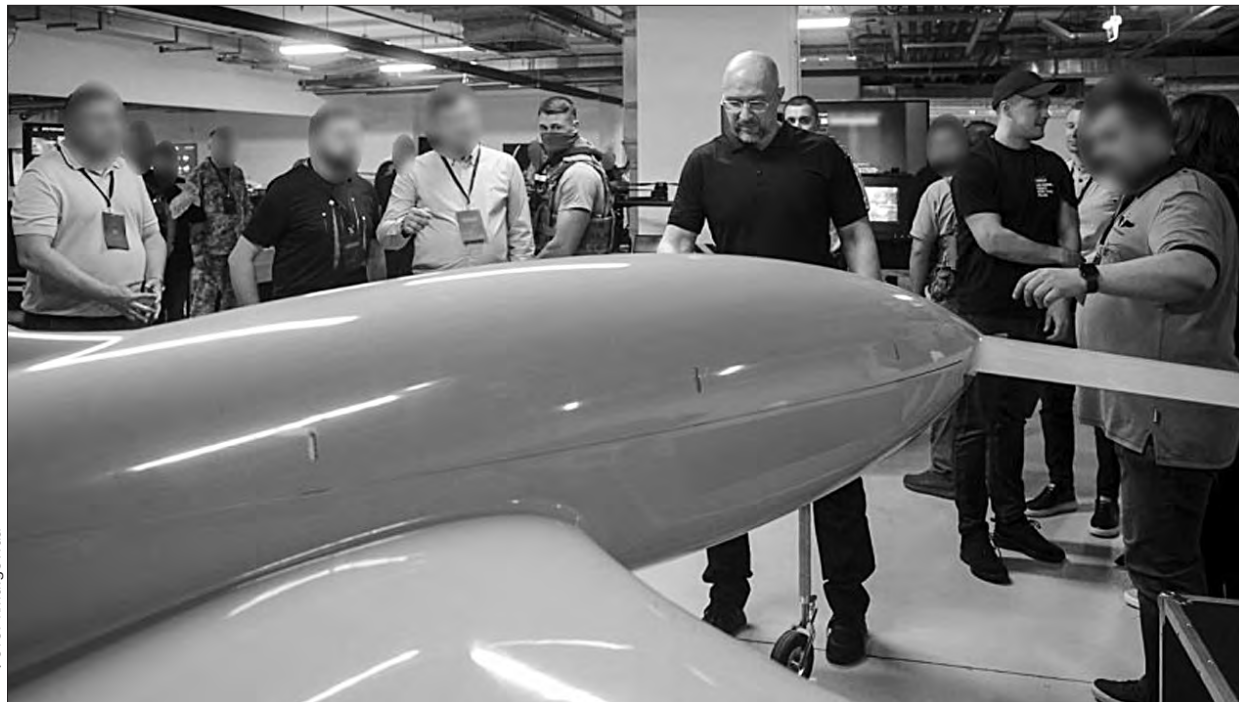
Прем'єр-міністр Денис Шмигаль під час форуму, присвяченого річниці проєкту «Армія дронів».

Атаки дронів на стратегічні об'єкти росіян в окупованому Криму та повітряні привітання безпілотників столиці московії стають дедалі масовішими. Київ офіційно не підтверджує причетності до цієї «бавовни з доставкою». Але міністр цифрової трансформації Михайло Федоров нещодавно натякнув: мовля, щоб там не відбувалося, але цього буде більше.