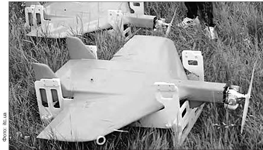
Український баражуючий беспилотник оперативно-стратегічного рівня «Рубака» здатен долати відстань у 500 км.